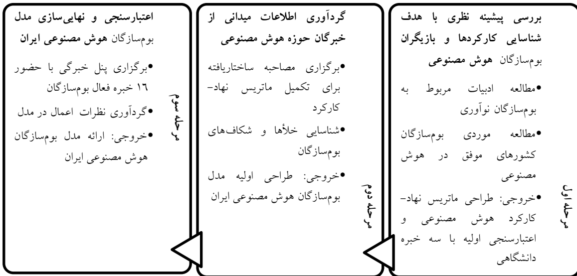
شکل ۱) فرآیند انجام پژوهش

تأثیرگذاری بالا با میانگین عدد ۳ با نارنجی تیره، تأثیرگذاری متوسط با رنگ نارنجی روشن و تأثیرگذاری کم با رنگ زرد نشان داده شده است. بازیگرانی که با نظر اکثریت خبرگان عدد ۱ را کسب نکردند، از فهرست بازیگران حذف شده و بدین معناست که به عنوان بازیگر اثرگذار در مرحله آغازین شکل‌گیری بوم‌سازگان مؤثر نیستند.